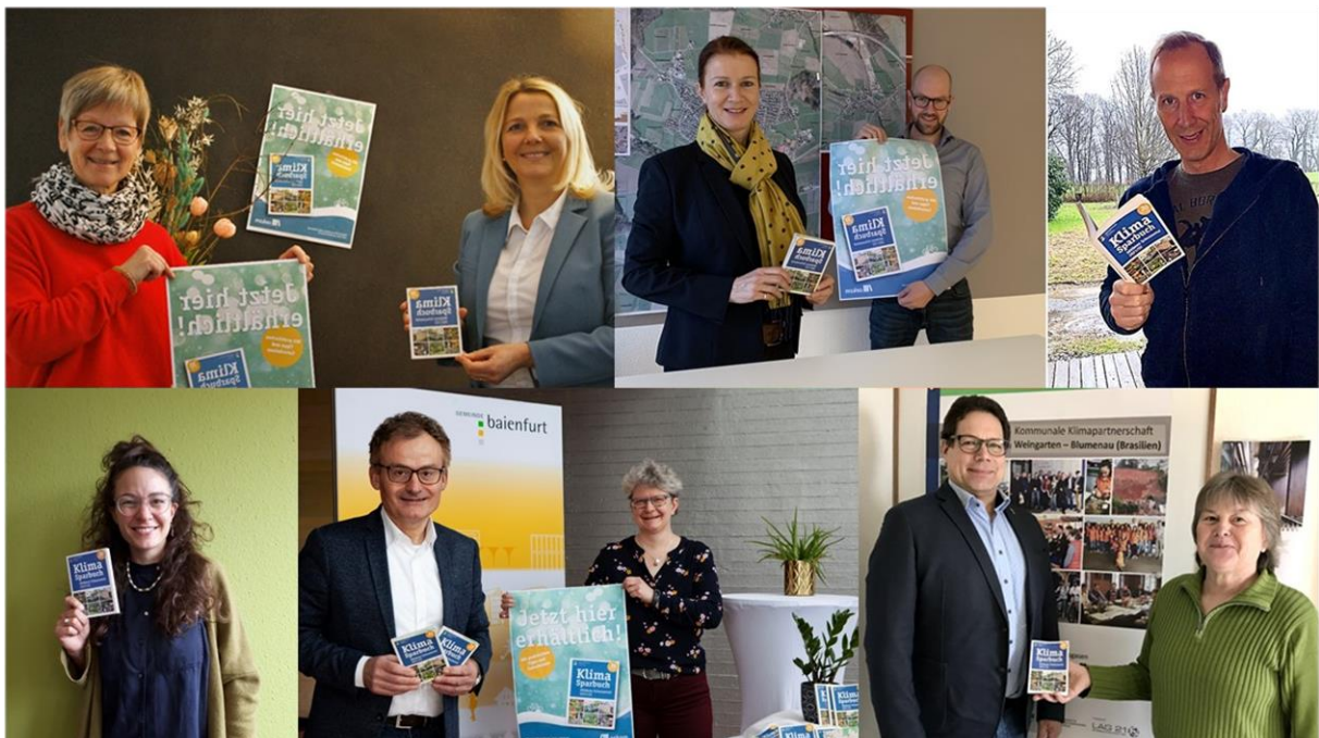
Das Klima-Team der GMS-Gemeinden freut sich sehr über das gelungene Klimasparbuch.

Ab sofort ist das Klimasparbuch in Baidt an der Bürgertheke und bei allen beteiligten Gemeinden sowie Gutscheinepartnern kostenlos erhältlich. Weitere Ausgabestandorte im gesamten Gemeindeverband Mittleres Schussental sowie die digitale Version des Klimasparbuchs finden Sie unter gmschussental.de .