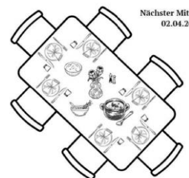
Nächster Mit 02.04.2