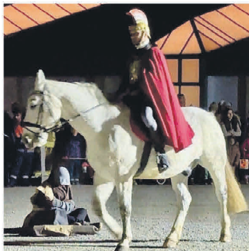
Szenenspiel aus dem Leben des Heiligen Sankt Martin

Wendeplatte bei der Froschstraße (hinter dem Sportplatz) um 17:30 Uhr