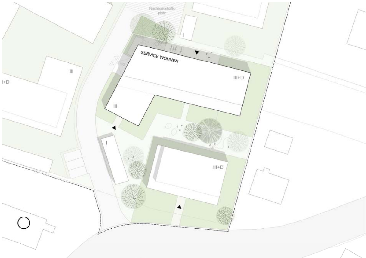
Lageplan Baufeld 2, 1. Bauabschnitt (Gebäude C oben und D unten)